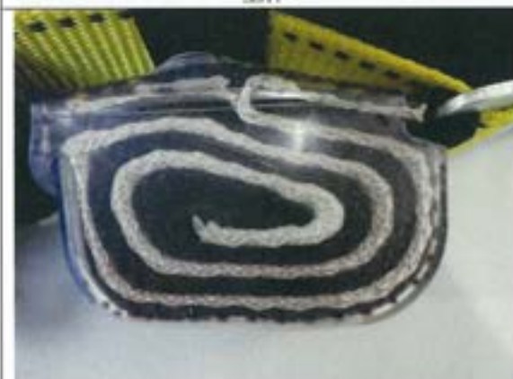
ショックアブソーバ