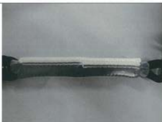
ショックアブソーバ