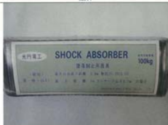
表示 (ショックアブソーバ)