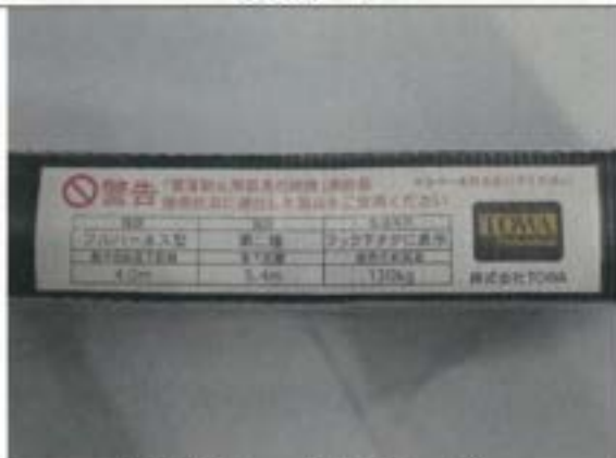
表示（ショックアブソーバ）