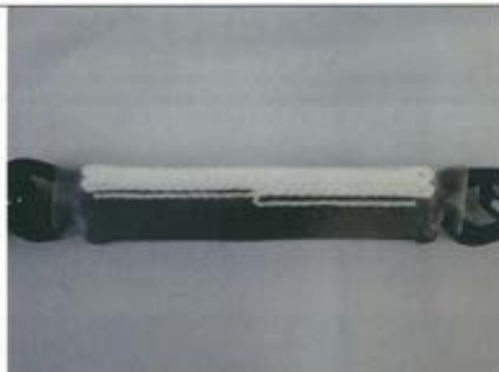
ショックアブソーバ