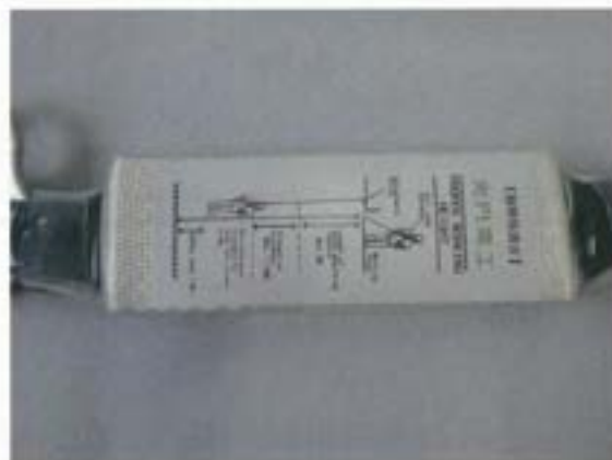
ショックアブソーバ