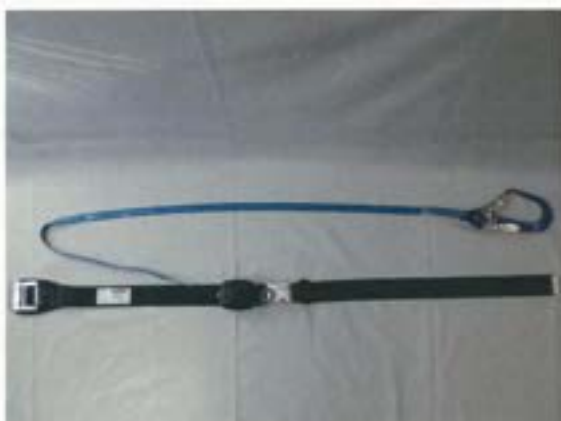
巻取器からストラップを引き出した状態