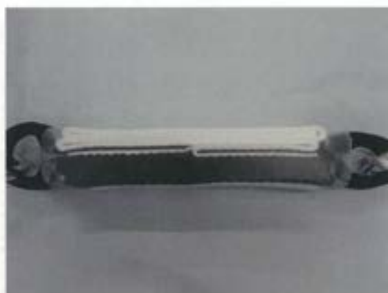
ショックアブソーバ