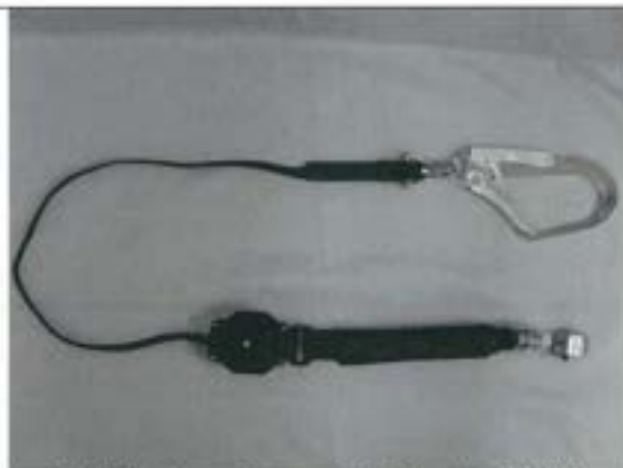
巻取り器からストラップを引き出した状態