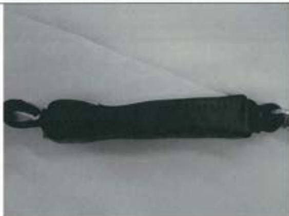
ショックアブソーバ