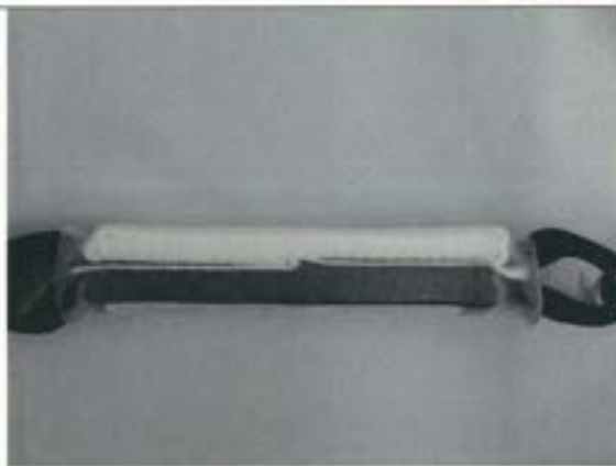
ショックアブソーバ