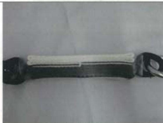
ショックアブソーバ