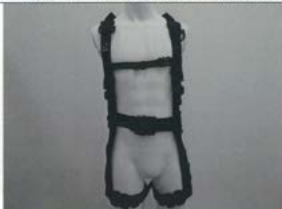
フルハーネス（前側）