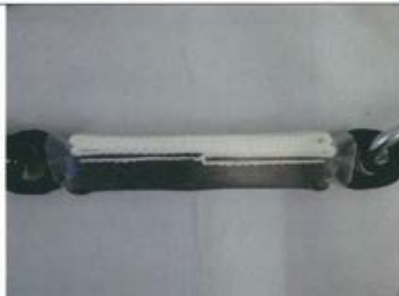
ショックアブソーバ