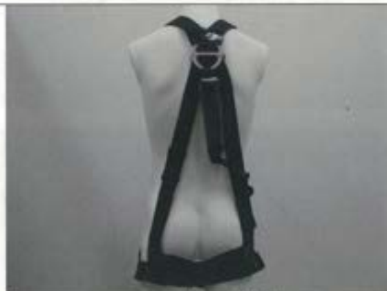
フルハーネス（後側）