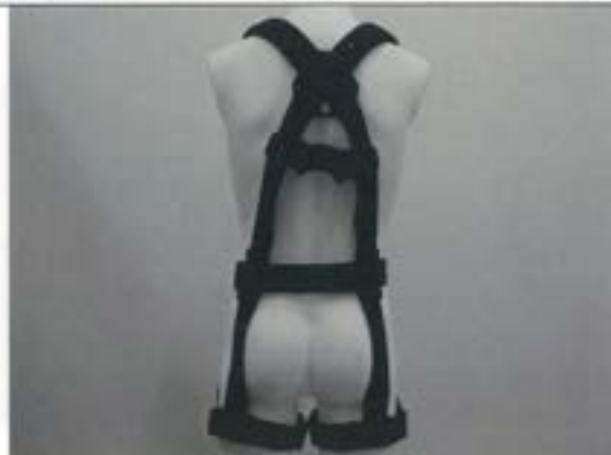
フルハーネス（後側）