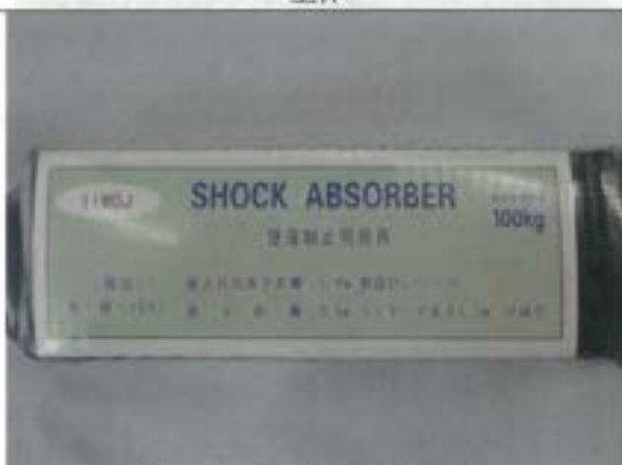
表示 (ショックアブソーバ)