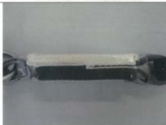
ショックアブソーバ