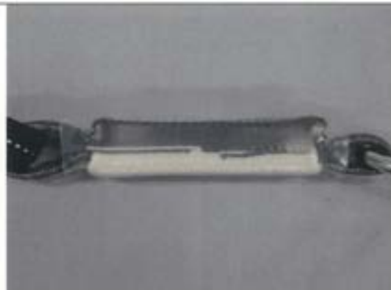
ショックアブソーバ