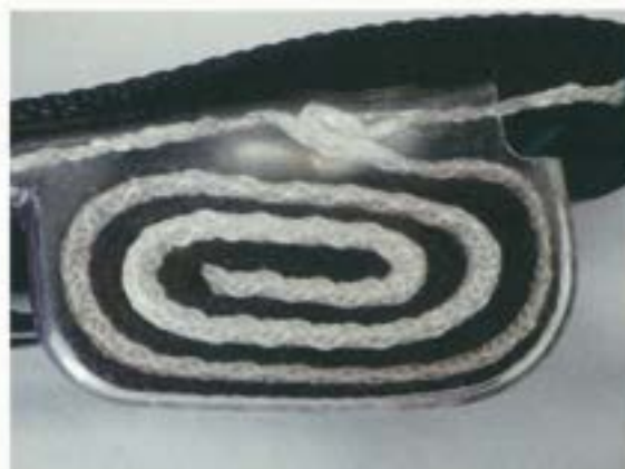
ショックアブソーバ