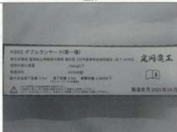
表示（ショックアブソーバ）