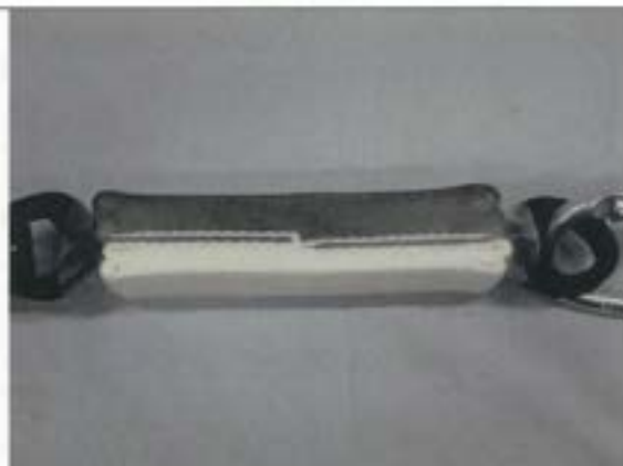
ショックアブソーバ