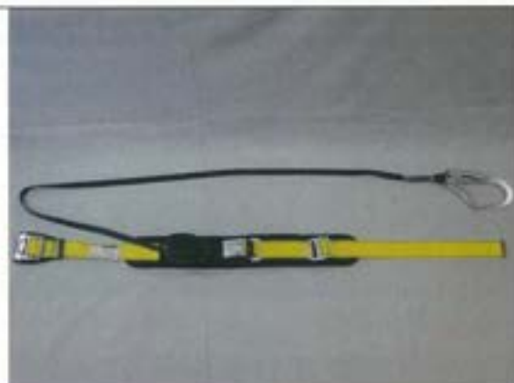
巻取器からストラップを引き出した状態