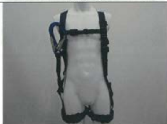
フルハーネス（前側）