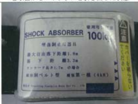
表示（ショックアブソーバ）