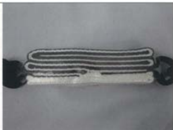
ショックアブソーバ