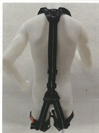
フルハーネス全体（後側）