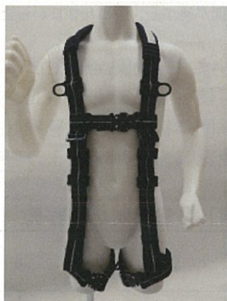
フルハーネス全体（前側）