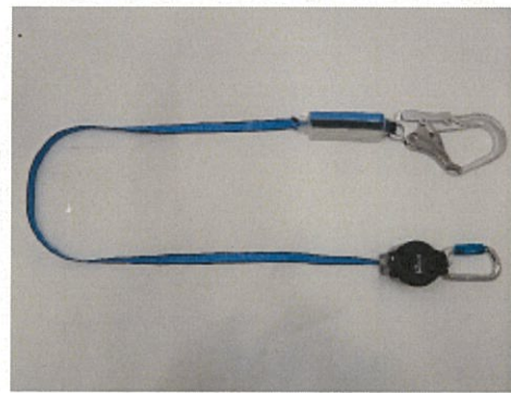
ランヤード全体 (巻取器からストラップを全て出した状態)