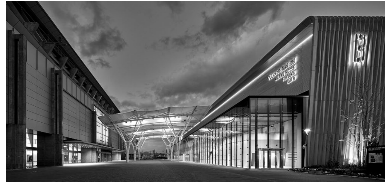
マリンメッセ福岡B館

申込方法 末尾の申込書で所属分会(裏面参照)へ9月22日(木)までにお申し込みください。(参加券は必要ありません)